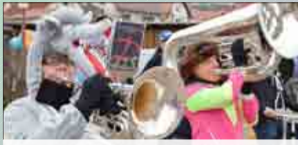
Seit Jahren unterhält die Marchingband Dietemann aus Eschwege die Karnevalisten in Diedorf.