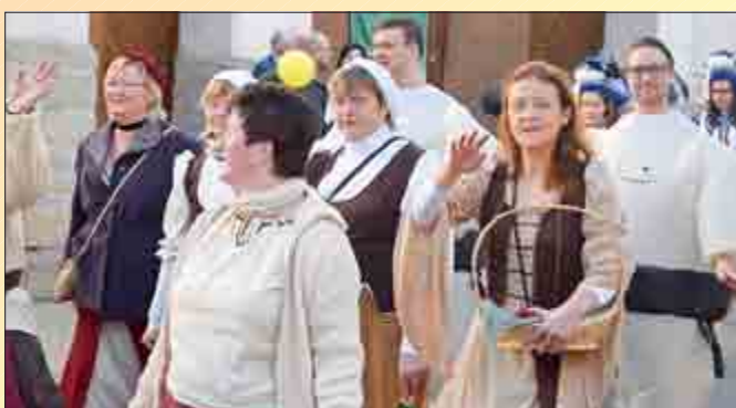
Auch die Knechtschaft vom Gut Keudelstein ließ sich den Umzug in Hildebrandshausen nicht nehmen.