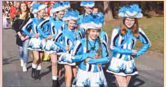
Lengenfelds Prinzengarde gratulierte den Jubilaren in Hildebrandshausen.