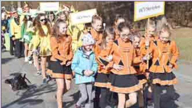
Hildebrandshausens drei Garden führten den Festumzug an.