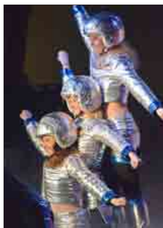
Der Showtanz „Rakete“ war einer der Höhepunkte im Heyeröder Hafen.

Heyerode. Dass das sprichwörtliche Narrenschiff in dieser Saison erstmals in der Festhalle „Heyeröder Hafen“ vor Anker gegangen war, schien der Besatzung rund um den Heyeröder Carnevalclub „HeyCC 1990“ sowie den gestrandeten Gästen außerordentlich gut bekommen zu sein.