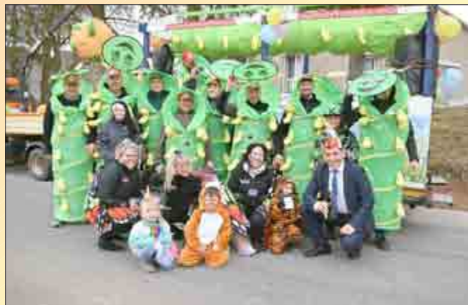
Heyerodes Feuerwehrverein beteiligte sich auch am Umzug bei den Nachbarn.