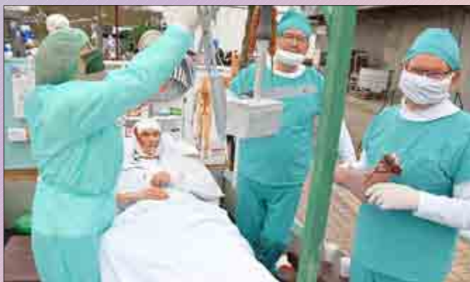
Für die neue TV-Serie „Die singenden Ärzte“ machte Diedorfs Chor „Cäcilia 1888“ schon einmal Werbung.