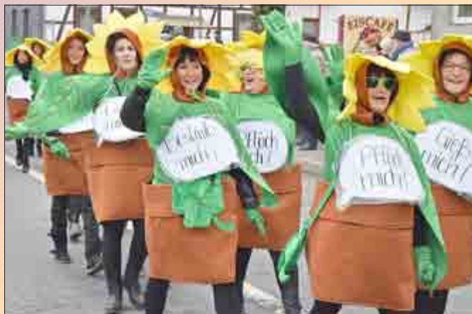
Die Elferratsdamen aus Diedorf.