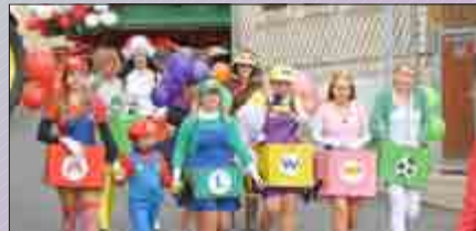
Buntes Treiben zum Rosenmontagsumzug in Heyerode.