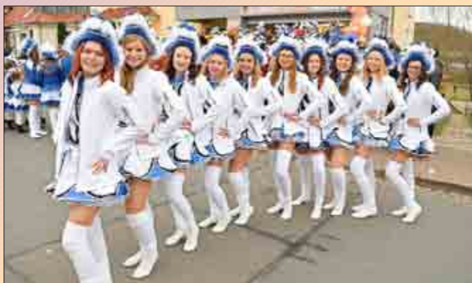
Diedorfs Prinzengarde 2019 kann sich sehen lassen.