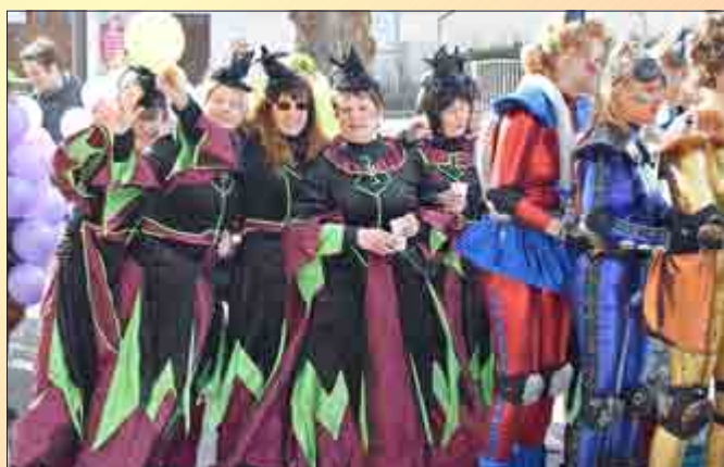
Zauberhaft präsentierten sich die Damen des Heyeröder Elferrates.