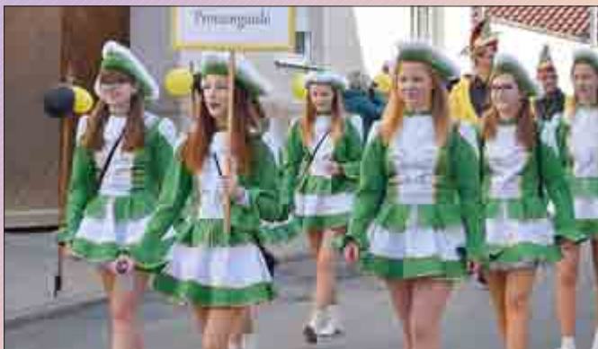
Die Prinzengarde des HCV Hildebrandshausen.