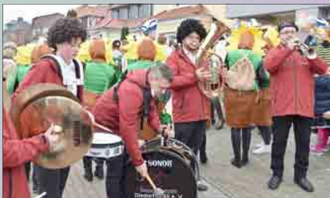
Die Bigband des Blasorchesters Diedorf gibt ein Ständchen.