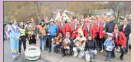
Wendehausens Elferrat und die Heuberg-Musikanten.