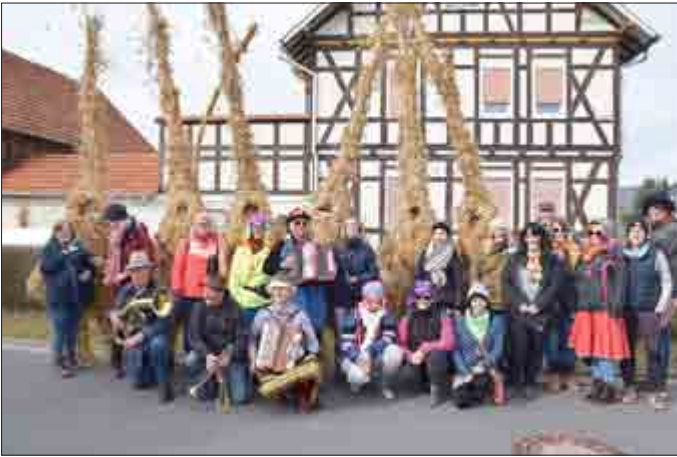
Hier die Stroh bärengesellschaft mit den Musikanten.

Dort lag das im vorigen Sommer vom Stroh bärenteams geerntete Roggenstroh, komplett und zumeist noch mit vollen Ähren, bereit. So konnten sich versierte Wickler und Helfer mit Stroh und Strick ans Werk machen.