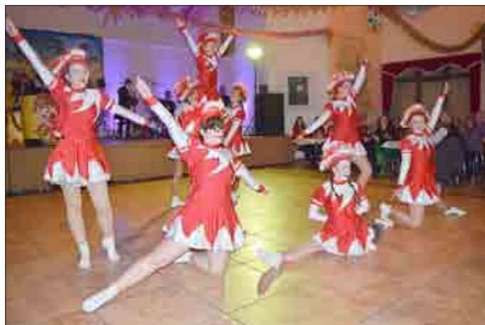
Hildebrandshausens große Garde kann sich sehen lassen.